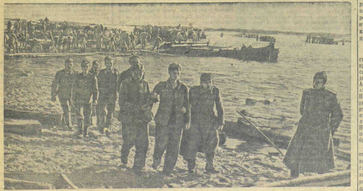
Гитлеровцы, захваченные в плен на правом берегу Днепра, переправлены на левый берег и направляются в тыл.

И. НИКИТИН, спец. корреспондент «Известия».